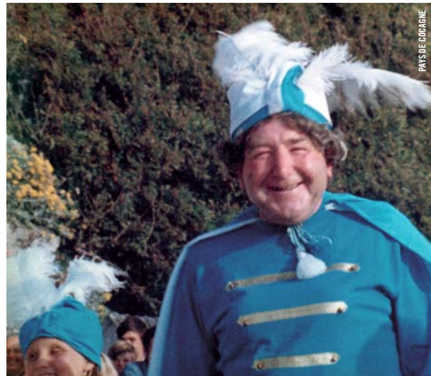
PAYS DE COCAGNE

LE GRAND AMOUR [Fr., 1969, 87 min, 35 mm copie restaurée, VOSTA] • Repris le 21 octobre, 18 h 30