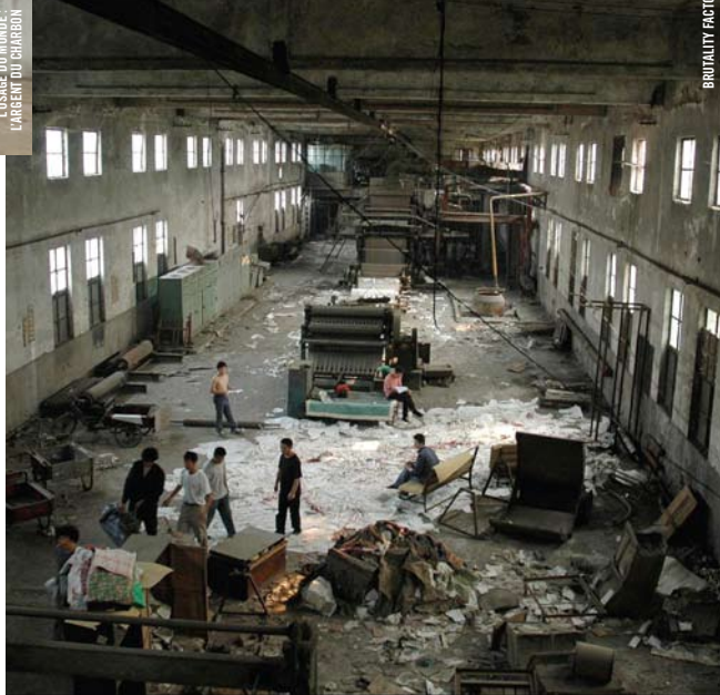
L'USAGE DU MONDE: L'ARGENT DU CHARBON

·: INSTALLATION ·: DAZIBAO EN RÉSIDENCE ·: DU 14 OCTOBRE AU 7 NOVEMBRE ·: La toute dernière œuvre vidéo de l'artiste multidisciplinaire Daniel Olson, Le Miroir de Magritte · SALLE NORMAN-McLAREN · ENTRÉE LIBRE ·