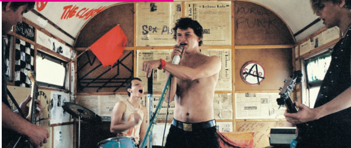
TOUT CE QUE J'AIME