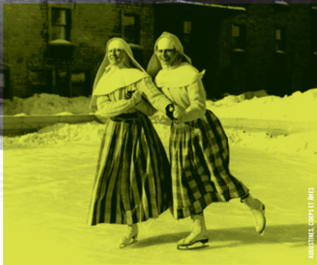
ALBUSTINES, CORPES ET JAMES