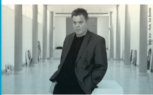
Amos Gitai