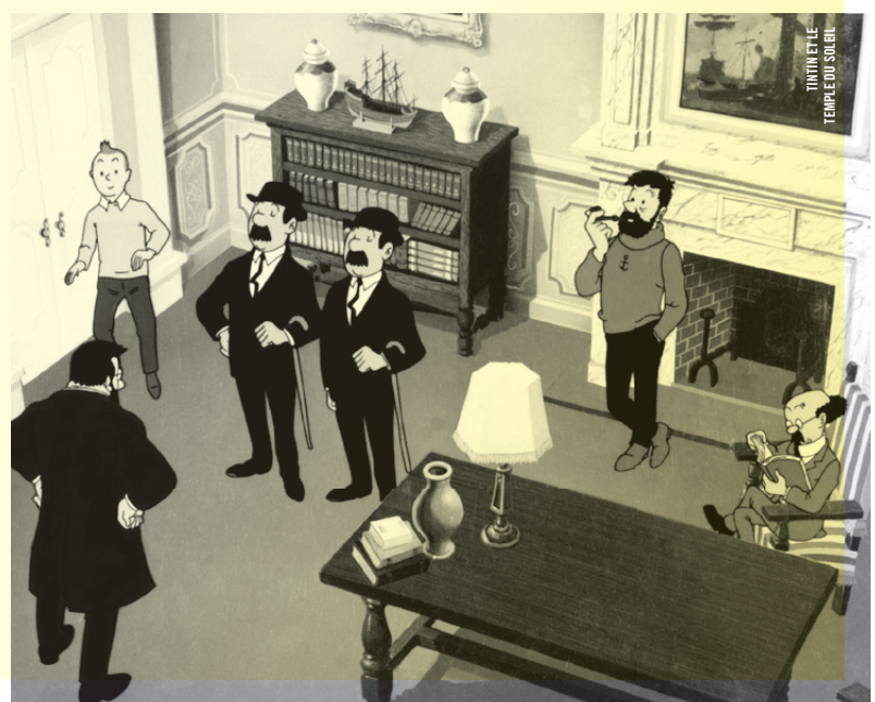
TINTIN ET LE TEMPLE DU SOLEIL