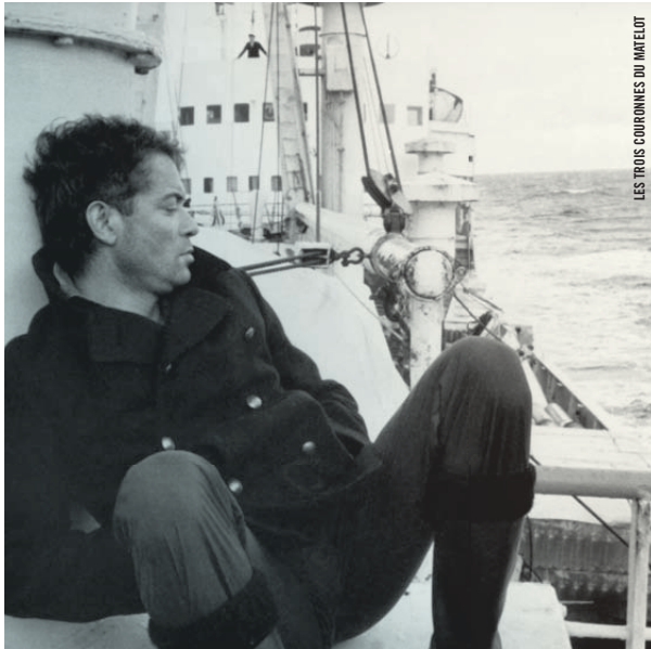
LES TROIS COURONNES DU MATELOT