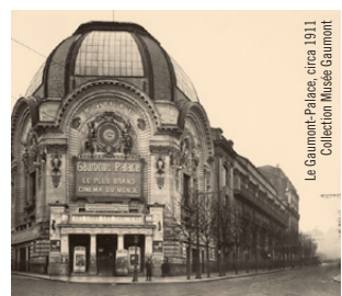
Le Gaumont-Palace, circa 1911

· DU 9 AU 16 DÉCEMBRE · Quelle était l'expérience d'une séance de cinéma pour nos ancêtres du début du siècle dernier? C'est ce que tente d'évoquer ce programme constitué de films qui auraient pu être projetés un jour de 1911 au Gaumont Palace , le « plus grand cinéma du monde ». Programme conçu par Mariann Lewinsky pour la section Cento anni fa du festival Il Cinema Ritrovato de Bologne, 2011.