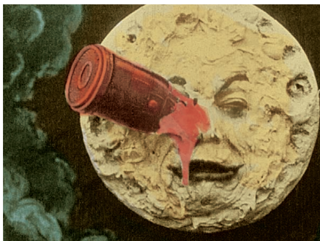
LE VOYAGE DANS LA LUNE