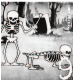
THE SKELETON DANCE

16 h - Salle Claude-Jutra Claude Miller (1942-2012) LA CLASSE DE NEIGE • Voir le 3 juin, 17 h