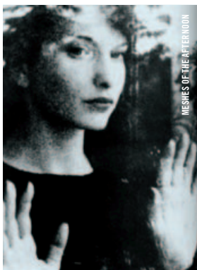
MESHES OF THE AFTERNOON

21 h - Salle Claude-Jutra Nicolas Winding Refn, mythologies contemporaines DRIVE • Voir le 6 juin, 20 h 30