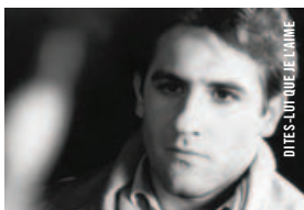
DITES-LUI QUE JE L'AIME

16 h - Salle Claude-Jutra Claude Miller (1942-2012) DITES-LUI QUE JE L'AIME Claude Miller [Fr., 1977, 105 min, 35 mm, VOF] • Repris le 1 er juillet, 18 h 30