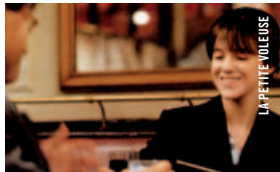
LA PETITE VOLEUSE

16 h - Salle Claude-Jutra Claude Miller (1942-2012) LA PETITE VOLEUSE Claude Miller [Fr., 1988, 109 min, 35 mm, VOF] • Repris le 17 juin, 17 h