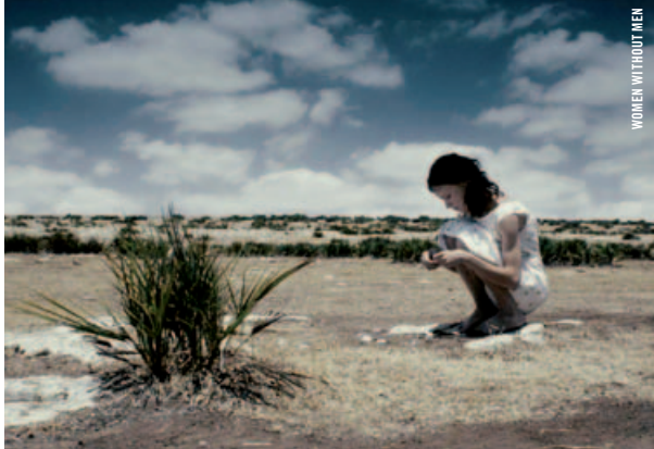
WOMEN WITHOUT MEN

18 h 30 - Salle Claude-Jutra Cinéma d'animation CHEFS-D'ŒUVRE DE LA COLLECTION The Haunted Hotel James Stuart Blackton [É.-U., 1907, 6 min à 20 i/s, 35 mm, INTA]; Komposition in blau Oskar Fischinger [All., 1935, 4 min, 35 mm, SD]; The Skeleton Dance Walt Disney [É.-U., 1929, 6 min, 35 mm, SD]; The Bird Store Wilfred Jackson [É.-U., 1931, 7 min, 35 mm, VOA]; Gallina Vogelbirdae Jiri Brdecka [Tchéc., 1963, 14 min, 35 mm, SD]; A Colour Box Len Lye [R.-U., 1935, 3 min, 35 mm, SD]; La Voix publique ( Offentlige rost ) Lejf Marcussen [Dan., 1988, 11 min, Beta num, SD]; Carré de lumière Claude Luyet [Suisse, 1992, 5 min, 35 mm Scope, SD] DURÉE TOTALE : 56 min