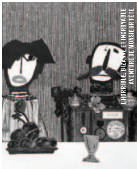
L'HORRIBLE, LE BIZARRE ET L'INCROYABLE AVENTURE DE MONSIEUR TÊTE

16 h - Salle Claude-Jutra Aimée Danis (1929-2012) LÉOLO Jean-Claude Lauzon [Fr.-Can.-Qué., 1992, 107 min, 35 mm, VOSTA]