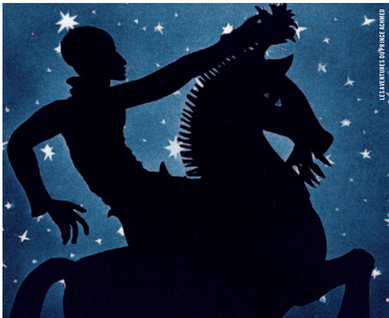
LES AVENTURES DU PRINCE ACHMED