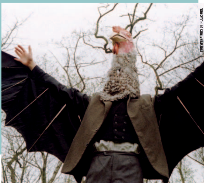
CONSPIRATORS OF PLEASURE