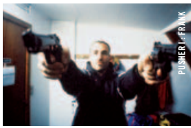
PUSHER I - FRANK

17 h - Salle Claude-Jutra Nicolas Winding Refn, mythologies contemporaines PUSHER I : FRANK • Voir le 1 er juin, 20 h 30