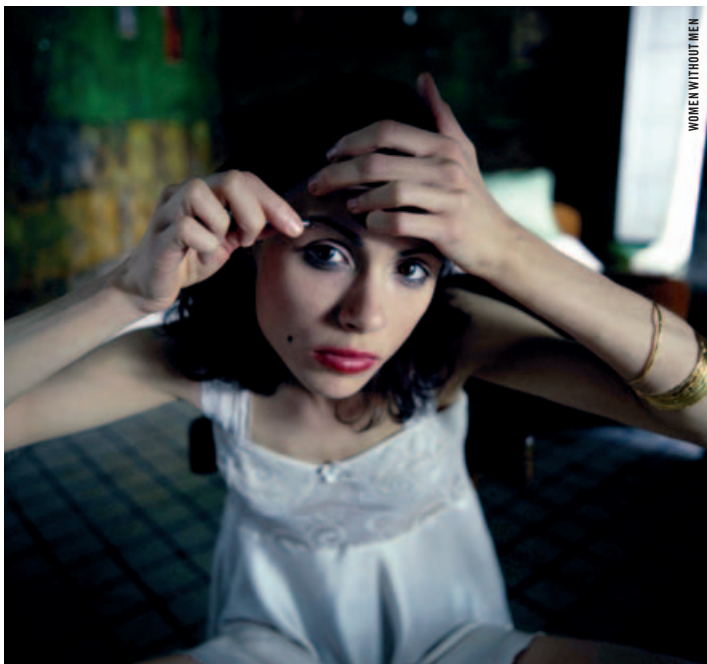
WOMEN WITHOUT MEN

·: DU 14 AU 30 JUIN ·: Pipilotti Rist, Steve McQueen, Sophie Calle, Rebecca Horn, Eija-Liisa Ahtila, Raymonde April, Shirin Neshat . En sept longs métrages singuliers, la Cinémathèque propose une immersion fascinante dans les univers profondément marquants des « stars » de l'art contemporain. Une occasion unique d'explorer comment des artistes, exceptionnellement regroupés au sein d'un même cycle, s'approprient les codes spatio-temporels et narratifs propres au cinéma.