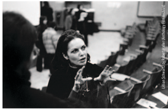
Lillian Schwartz

22 SEPTEMBRE : Depuis plus de 30 ans, l'artiste Lillian Schwartz conçoit des films, des vidéos, de l'infographie et des œuvres d'art aux laboratoires Bell de AT&T. Travaillant étroitement avec certains des plus éminents scientifiques au monde et des musiciens s'intéressant à l'informatique et aux synthétiseurs, elle explore le potentiel créatif des technologies de pointe.