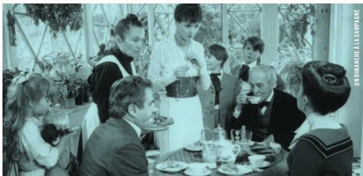
UN DIMANCHE À LA CAMPAGNE