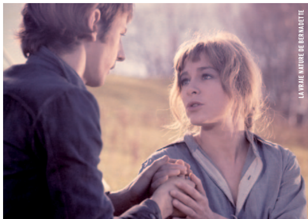
LA VRAIE NATURE DE BERNADETTE