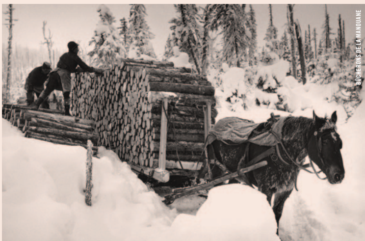
BÛCHERONS DE LA MANOÜANE

· 6 AU 27 OCTOBRE · Chris Marker est décédé le 30 juillet dernier. Nous ne pouvions passer sous silence la disparition de cet immense créateur. Figure majeure du cinéma contemporain, Chris Marker s'est imposé par un cinéma personnel et engagé, aux limites du documentaire et de l'essai. Nous vous proposons cinq films tirés de nos collections où, libre et passionné, il parcourt et interroge le monde.