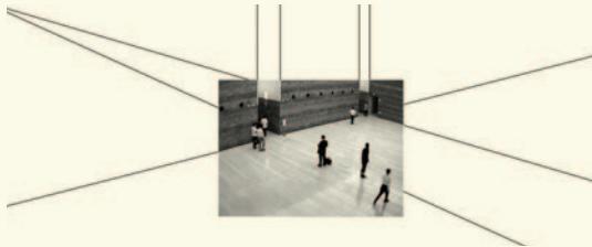
PLAZA WIL, 2007

DU 6 SEPTEMBRE AU 28 OCTOBRE : À travers ses œuvres vidéo, l'artiste franco-colombienne Tania Ruiz Gutiérrez s'interroge sur les modes de représentation du temps et de l'espace, tout en proposant une réflexion sur le devenir de la ville. Mêlant traditions populaires et grand art, elle nous montre que les systèmes de représentation tels que la perspective et la succession linéaire du temps ne sont pas des données, mais véhiculent des conceptions du monde particulières. L'exposition est une production de DAGAFO présentée en collaboration avec la Cinémathèque québécoise et la Galerie de l'UQAM, avec l'appui du Conseil des arts et des lettres du Québec et du Service de coopération et d'action culturelle du Consulat général de France à Québec. SALLE NORMAN-McLAREN • ENTRÉE LIBRE