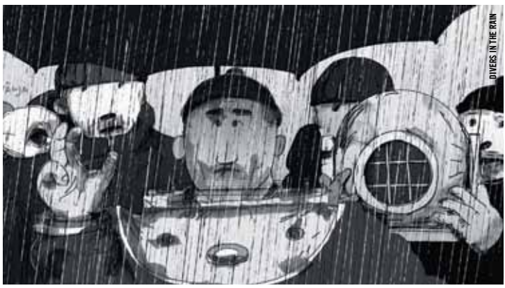
DIVERS IN THE RAIN