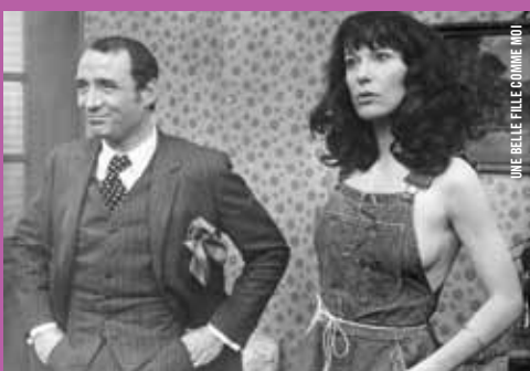
UNE BELLE FILLE COMME MOI