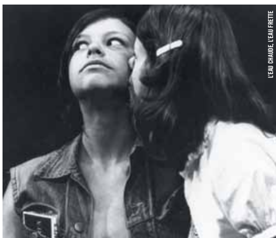
L'EAU CHAUDE, L'EAU FRETTE