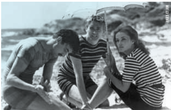
JULES ET JIM

19 h - Salle Claude-Jutra OUMP et films d'amour Court métrage INIS suivi de GONE WITH THE WIND Victor Fleming [É.-U., 1939, 238 min, 35 mm, VOA]