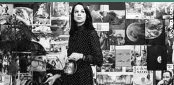
LES BEAUTÉS BLANCHES