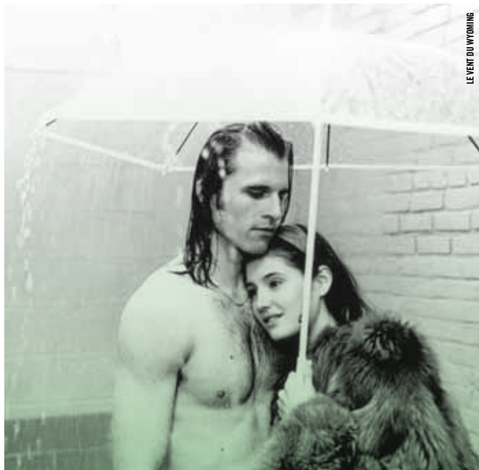
LE VENT DU WYOMING