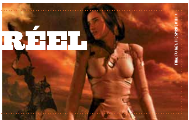
FINAL FANTASY: THE SPIRITS WITHIN