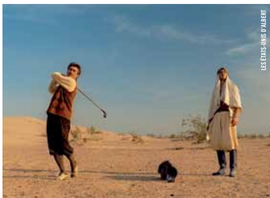
LES ÉTATS-LIENS D'ALBERT