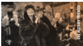
UNE HISTOIRE INVENTÉE

18 h 30 · Salle Fernand-Seguin Félix Leclerc : 25 ans RÉCITAL FÉLIX LECLERC • Voir les 11 et 18 septembre, 18 h 30 Repris le 20 septembre, 18 h 30