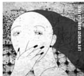
LIFE WITHOUT GABRIELLA FERRI