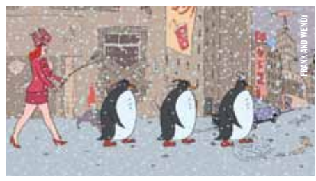
FRANK AND MERRY