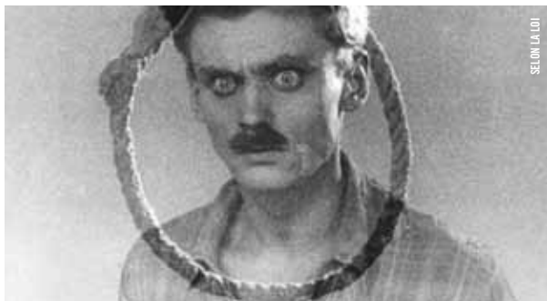
SELON LA LOI

18 h 30 - Salle Claude-Jutra Corps simulacres The Tantalizing Fly Dave Fleischer [É.-U., 1919, 5 min, 16 mm, SD]; Betty Boop's Museum Dave Fleischer [É.-U., 1932, 7 min, 16 mm, VOA]; Popeye the Sailor Dave Fleischer [É.-U., 1933, 7 min, 35 mm, VOA]; Superman - The Death Ray Dave Fleischer [É.-U., 1941, 10 min, 16 mm, VOA]; Gulliver's Travels Dave Fleischer [É.-U., 1939, 72 min, 16 mm, VOA] PRÉSENTÉ PAR JUSTIN BAILLARGEON, PROGRAMMATEUR INVITÉ