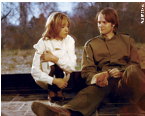
PAULINA S'EN VA

LISEZ LES RÉSUMÉS DES FILMS AU CINEMATHEQUE.QC.CA