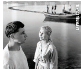
LA POINTE COURTE