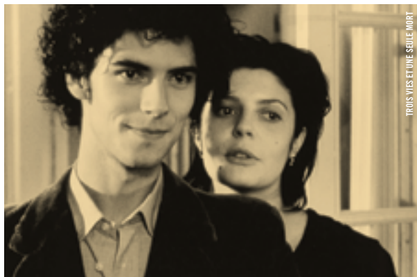
TROIS VIES ET UNE SEULE MORT

18 h 30 - Salle Fernand-Seguin Lydie Jean-Dit-Pannel Cela avait commencé par un accident [Fr., 2014, 9 min, num]; Struggles [Qué., 2011, 7 min, vidéo]; Arm in Arm [Qué., 2006, 1 min, vidéo]; Oh my Dog! [Qué., 2007, 2 min, num]; BBATS [Qué., 1994, 2 min, vidéo]; 7 chants [Qué., 1994, 3 min, vidéo]; J'ai rêvé que j'étais toi [Qué., 1991, 3 min, vidéo]; Mille E Tre [Qué., 1990, 22 min, vidéo]