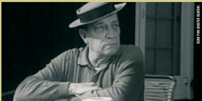
DEAD PAN (BUSTER KEATON)