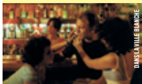
DANS LA VILLE BLANCHE

17 h - Salle Claude-Jutra Les Essentiels DANS LA VILLE BLANCHE Alain Tanner [Suisse-R.-U.-Port., 1983, 108 min, 35 mm, VOF]