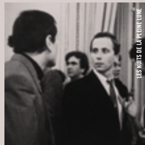
LES NUITS DE LA PLEINE LUNE