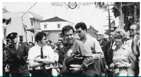
Collection multimediale québécoise