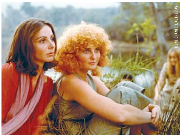
UNE CHANTE, L'AUTRE PAS

17 h · 20 x 5 MISSISSIPPI BLUES © Bertrand Tavernier, Robert Parrish [Fr.-É.-U., 1984, 96 min, 35 mm, VOSTF]