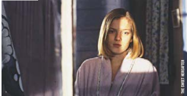
THE SWEET HEREFTER