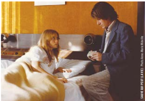
SAUVE QUI PEUT (LA VIE)

20 h 30 · 20 x 5 PARTIE DE CAMPAGNE © Jean Renoir [Fr., 1946, 40 min, 35 mm, VOF]