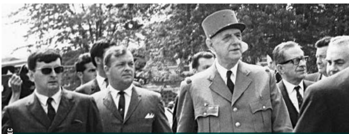
LA VISITE DU GÉNÉRAL DE GAULLE AU QUÉBEC