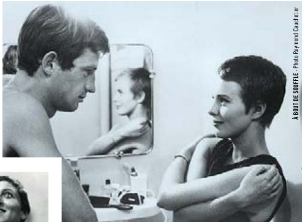
A BOUT DE SOUFFLE