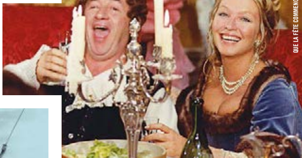
QUE LA FÊTE COMMENCE