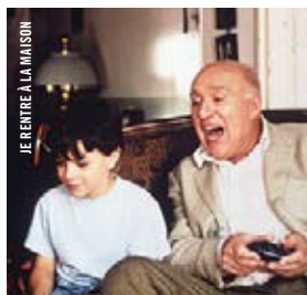
JE RENTRE À LA MAISON

21 h · 20 x 5 JE RENTRE À LA MAISON © Manoel de Oliveira [Fr.-Port., 2001, 90 min, 35 mm, VOF]