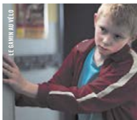
LE GAMIN AU VÉLO

21 h 30 · Fantasia 2017 / Larry Cohen Q © Larry Cohen [É.-U., 1982, 91 min, 35 mm, VOA] EN PRÉSENCE DE LARRY COHEN ET MICHAEL MORIARTY