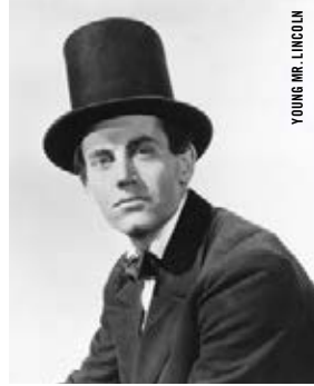
YOUNG MR. LINCOLN

21 h · 20 x 5 LA MÉLODIE DES PRAIRIES © (A PRAIRIE HOME COMPANION) Robert Altman [É.-U., 2006, 105 min, 35 mm, VOSTF]