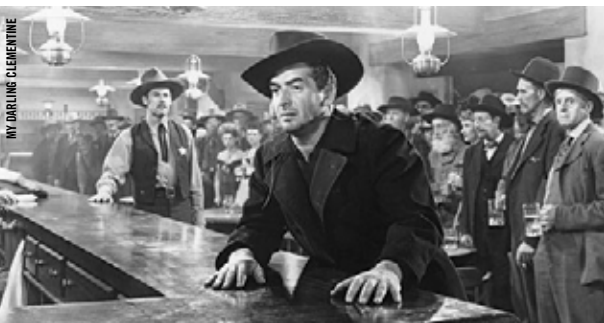
MY DARLING CLEMENTINE