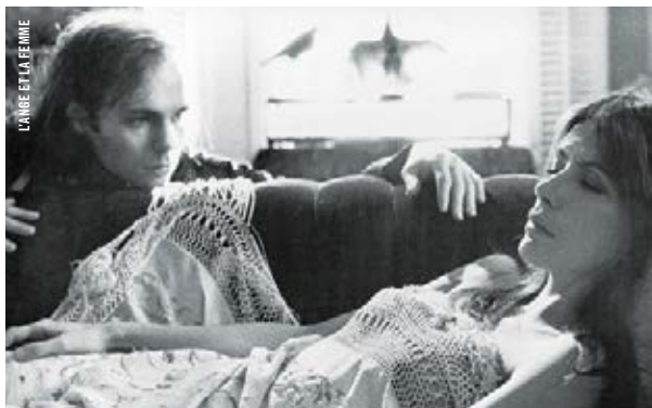
L'ANGE ET LA FEMME

19 h · 20 x 5 LA FILLE DE D'ARTAGNAN © Bertrand Tavernier [Fr., 1994, 129 min, 35 mm, VOF]