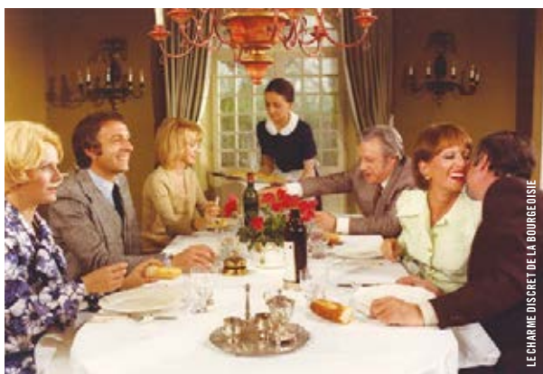
LE CHARME DISCRET DE LA BOURGEOISIE