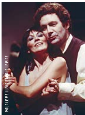
POUR LE MEILLEUR ET POUR LE PIRE

19 h · 20 x 5 / Éléphant présente LA DAME EN COULEURS Claude Jutra [Qué., 1985, 114 min, DCP, VOA] EN PRÉSENCE D'INVITÉS