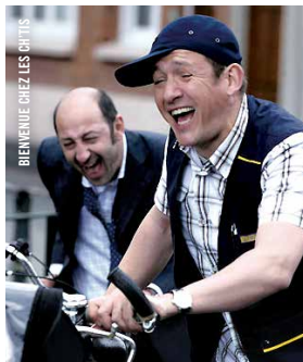
BIENVENUE CHEZ LES CHT'IS

19 h · Comédies ! LA COMÉDIE DU TRAVAIL © Luc Moullet [Fr., 1987, 90 min, 35 mm, VOF]