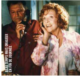
BEAU TEMPS MAIS ORAGEUX EN FIN DE JOURNÉE

19 h · Comédies ! LA JEUNE FILLE AU CARTON À CHAPEAU Boris Barnet [URSS, 1927, 67 min, 35 mm, INTSTF et STA] AU PIANO : ROMAN ZAVADA