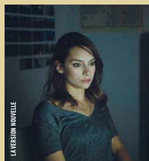
LA VERSION NOUVELLE