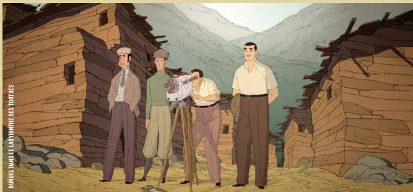
BONJOUR DANS LE LABYRINTHE DES TORTUES