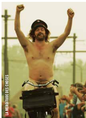
LA MERITUDE DES CHOSES