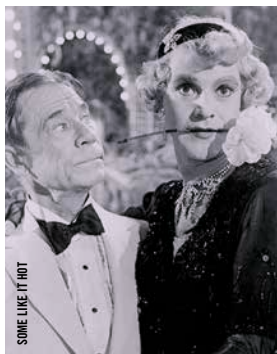
SOME LIKE IT HOT

Noah Baumbach [É.-U., 2010, 107 min, 35 mm, VOA]