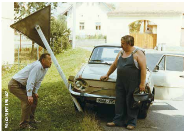
MON CHER PETIT VILLAGE