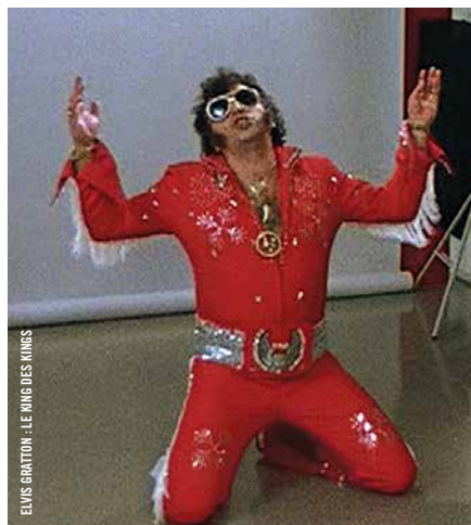
ELVIS GRATTON - LE KING DES KINGS