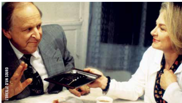
L'OREILLE D'UN SOURD