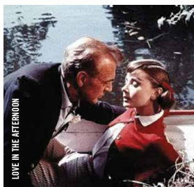
LOVE IN THE AFTERNOON

21 h · Comédies ! IN THE COMPANY OF MEN © Neil LaBute [Can.-É.-U., 1997, 97 min, 35 mm, VOA]