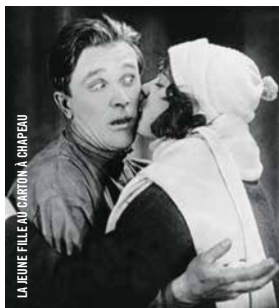
LA JEUNE FILLE AU CARTON À CHAPEAU

21 h · Comédies ! TO BE OR NOT TO BE Ernst Lubitsch [É.-U., 1942, 99 min, 16 mm, VOA]