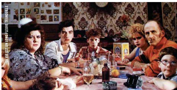
LA VIE EST UN LONG FLEUVE TRANQUILLE

19 h · Comédies ! NOUS, LES VIVANTS © (DU LEVANDE) Roy Andersson [Suède-All.-Fr.-Dan.-Norv.-Jap., 2007, 95 min, 35 mm, VOSTF]