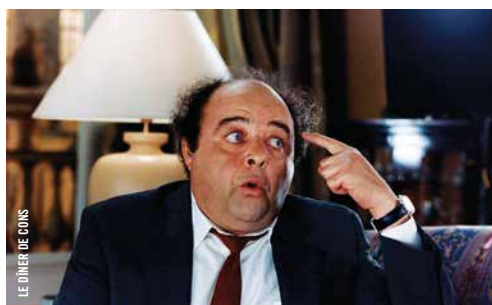
LE DÎNER DE CONS