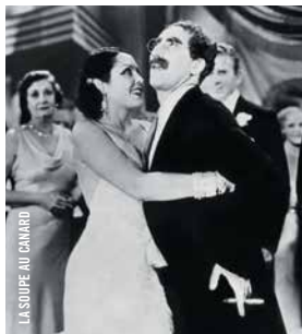
LA SOUPE AU CANARD

The Fatal Glass of Beer © Clyde Bruckman [É.-U., 1933, 18 min, 35 mm, VOSTF]; The Pharmacist © Arthur Ripley [É.-U., 1933, 19 min, 35 mm, VOSTF];