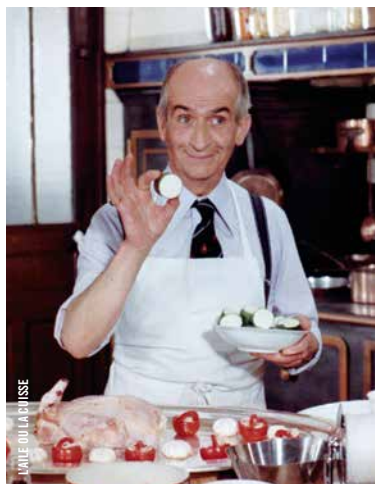
LA VIE OÙ LA PÂSSE