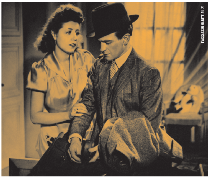
L'ASSASSIN HABITE AU 21

·: DU 18 AU 29 AVRIL ·: En 2011, la Cinémathèque a accueilli la collection de films des archives du Festival des films du monde . Plus de 1200 copies, tous formats et types confondus qui dormaient jusqu'alors dans les voutes du cinéma Impérial. De véritables trésors, qui viennent enrichir la collection de la Cinémathèque : Madame Bovary de Jean Renoir (1934), L'heure du loup d'Ingmar Bergman (1968) ou L'Assassin habite au 21 (1942) d'Henri-Georges Clouzot et bien d'autres.