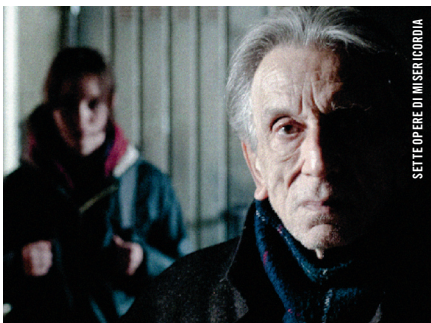
SETTE OPERE DI MISERICORDIA