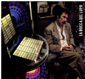
LA BOCCA DEL LUPO

Pierre Marcello [It., 2009, 76 min, 35 mm, VOSTF] PRÉSENTÉ PAR MARCO BERTOZZI