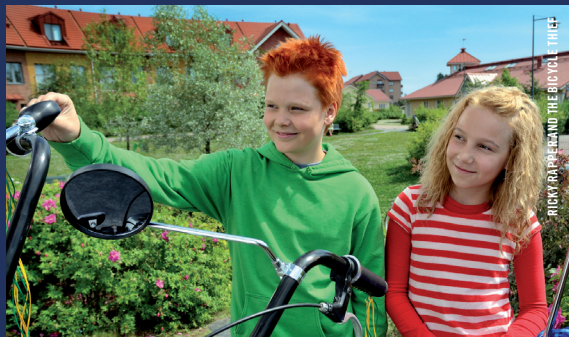
RICKY RAPPER AND THE BICYCLE THIEF