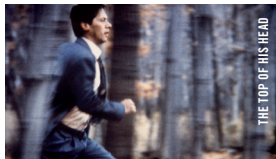
THE TOP OF HIS HEAD