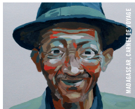
MADAGASCAR, CARNET DE VOYAGE