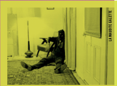
LA MAUITE GALETTE