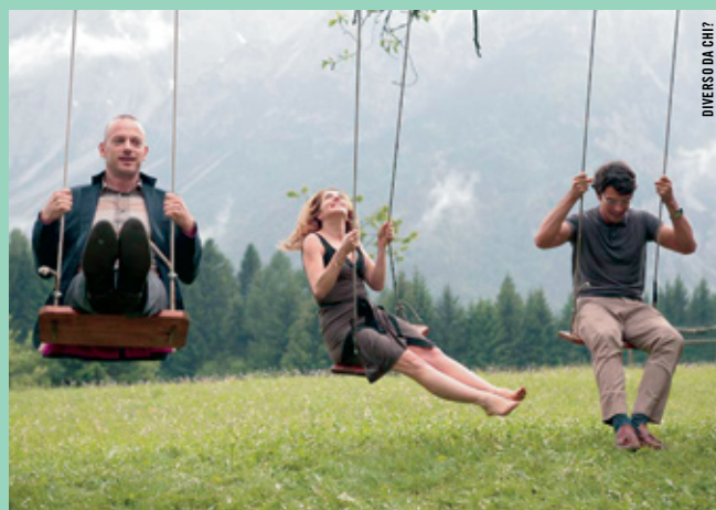
DIVERSO DA CHI?