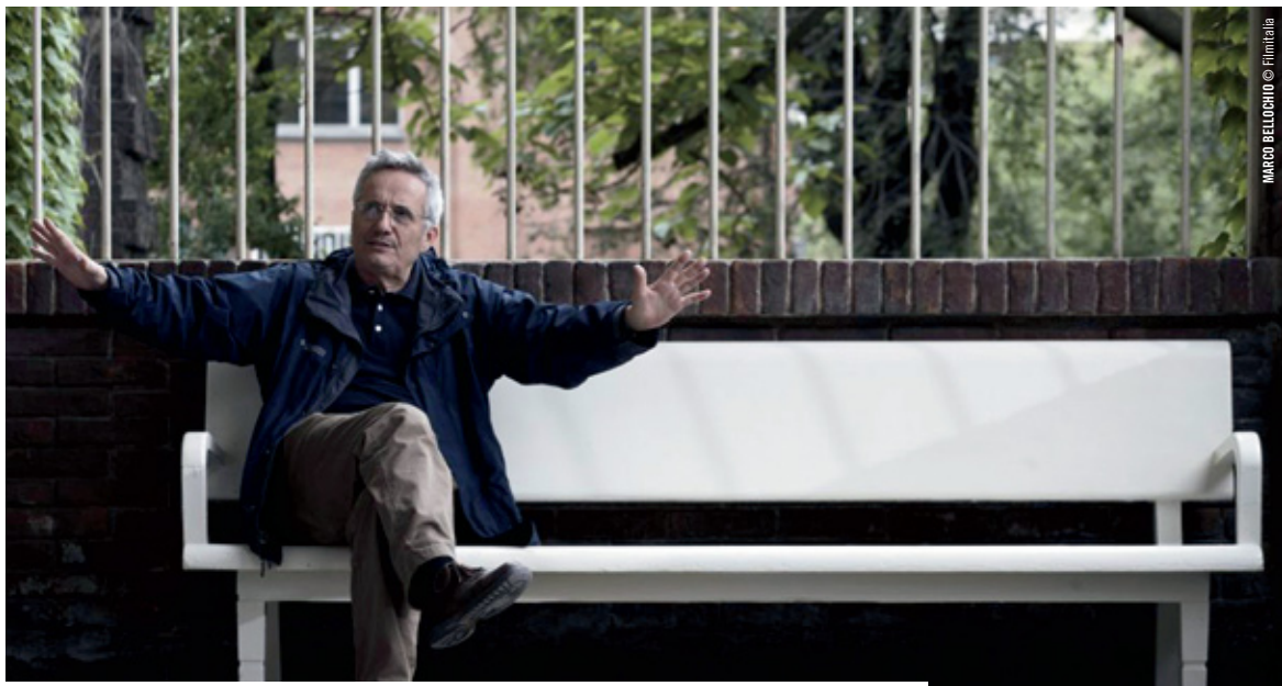
MARCO BELLOCCHIO