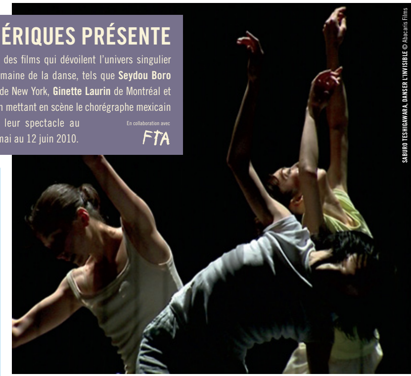
SABURO TESHIGAWARA, DANSEUR L'INVISIBLE

DU 6 MAI AU 27 JUIN : L'installation immersive et interactive de Luc Courchesne est présentée en première mondiale. À l'aide de ses images « panoscopiques », l'inventeur de ce dispositif inédit transforme le spectateur en visiteur/acteur et l'invite à se « mettre les pieds à l'eau » sur des plages d'Amérique, d'Europe et d'Asie. Une présentation d'Elektra et de la Cinémathèque québécoise en collaboration avec la SAT et l'Université de Montréal. SALLE NORMAN-MCLAREN