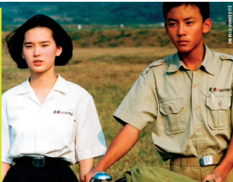
UNE BELLE JOURNÉE D'ÉTÉ

EN COLLABORATION AVEC LE BUREAU DE REPRÉSENTATION DE TAIPEI AU CANADA