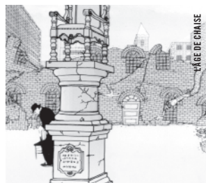
L'ÂGE DE CHASSE

21 h - Salle Claude-Jutra 150 ans de l'Unité italienne ALLONSANFAN Paolo et Vittorio Taviani [It., 1974, 111 min, 35 mm, VOSTF]