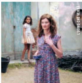
L'UOMO CHE VERRÀ

20 h 30 · Salle Claude-Jutra Eduardo Coutinho UN HOMME À ABATTRE (CABRA MARCADO PARA MORRER) [Brésil, 1985, 119 min, 35 mm, VOSTF] EN PRÉSENCE DU RÉALISATEUR • Repris le 28 mai, 21 h