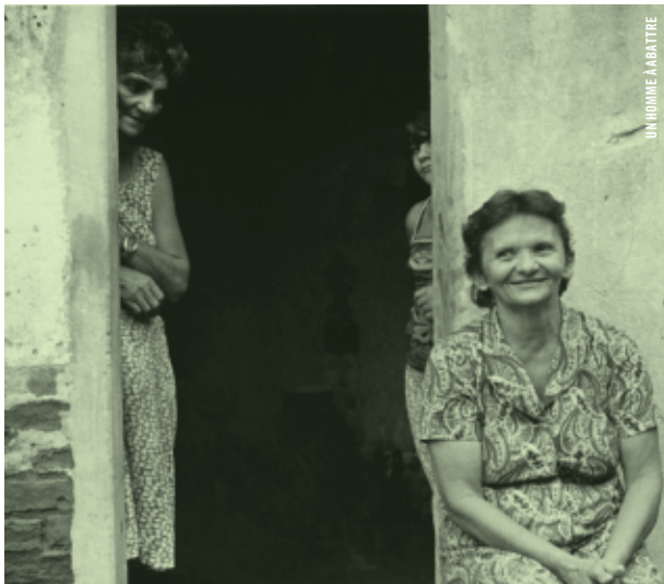
UN HOMME À ABATTRE