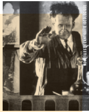
NOUVELLES DE L'ANTIQUITÉ IDÉOLOGIQUE

18 h 30 - Salle Claude-Jutra Animation et architecture L'ARCHITECTURE COMME INSTRUMENT IDÉOLOGIQUE L'Escalier (Schody) Stefan Schabenbeck [Pol., 1969, 7 min, 35 mm Scope, SD]; La Joie de vivre Anthony Gross, Hector Hoppin [Fr., 1934, 11 min, 35 mm, SD]; Le millionnaire qui vola le soleil (O milionari ktery ukradl slunce) Zdenek Miler [Tché., 1948, 8 min, 35 mm, SD]; Drux Flux Théodore Ushev [Qué., 2008, 5 min, 35 mm, SD]; L'Âge de chaise / Chairmen Jean-Thomas Bédard [Qué., 1978, 13 min, 35 mm, SD]; Tower Bawher Théodore Ushev [Qué., 2005, 4 min, Beta num, SD]; Tango Zbigniew Rybczynski [Pol., 1980, 8 min, 16 mm, SD]; The Message Raimund Krumme [All., 2000, 6 min, 35 mm, VOA]; Léviathan (Levijatan) Simon Bogojevic-Narath [Croatie, 2006, 15 min, 35 mm, SD] Durée totale : 77 min