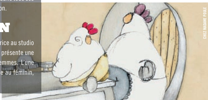
CHEZ MADAME POULE