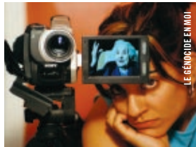
LE GÉNOCIDE EN MOI

21 h · Salle Claude-Jutra Eduardo Coutinho UN HOMME À ABATTRE (CABRA MARCADO PARA MORRER) • Voir le 18 mai, 20 h 30