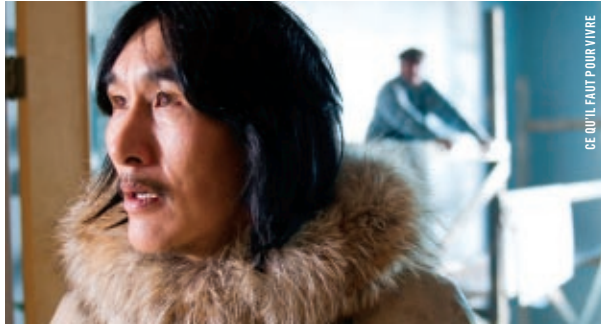
CE QU'IL FAUT POUR VIVRE

13 h 30 - Salle Claude-Jutra ACPAV, un quarantième CE QU'IL FAUT POUR VIVRE Benoît Pilon [Qué., 2008, 102 min, 35 mm, VOF] EN PRÉSENCE DU RÉALISATEUR