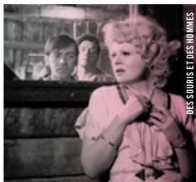
DES SOURIS ET DES HOMMES

20 h 30 · Salle Claude-Jutra Panorama balte et nordique ARMADILLO Janus Metz Pedersen [Dan., 2010, 105 min, Blu-Ray, VOSTA]