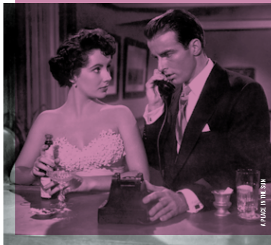
A PLACE IN THE SUN

·: DU 7 AU 9 JUILLET ·: Le hasard a voulu qu' Elizabeth Taylor et Marie-France Pisier nous quittent à quelques semaines d'intervalle. Les deux actrices semblent avoir eu des trajectoires aux antipodes : la star hollywoodienne, mythe vivant pour ses conduites scandaleuses, et la muse discrète du cinéma d'auteur français. Toutes deux partageaient pourtant un culot, une liberté et, bien sûr, un talent rare. Revoyez la jeune Elizabeth dans A Place in the Sun et Pisier dans Les Sœurs Brontë de Téchiné et L'Amour en fuite de Truffaut , qu'elle a aussi coscénarisé.