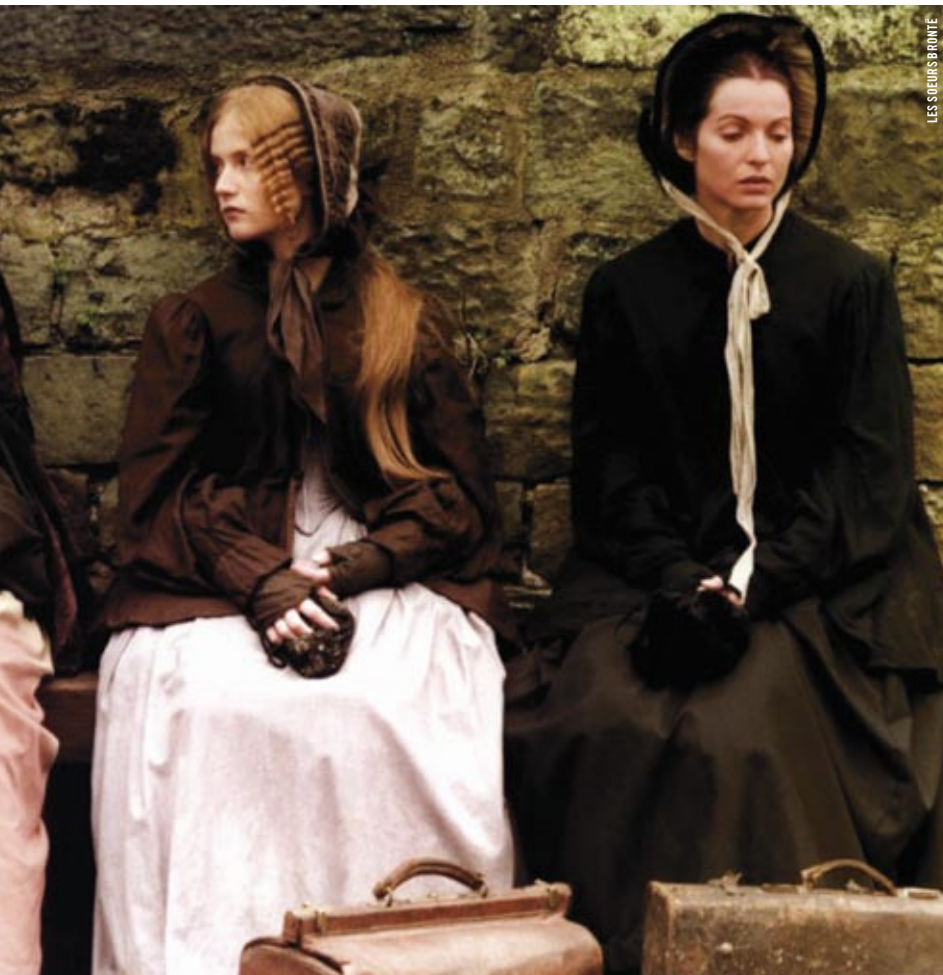
LES SŒURS BRONTË

LES PROJECTIONS FONT RELÂCHE JUSQU'AU 7 SEPTEMBRE.