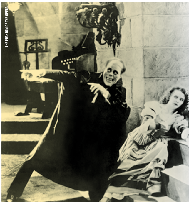
THE PHANTOM OF THE OPERA