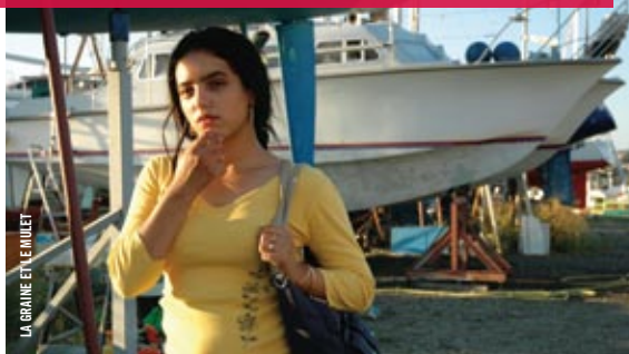
LA GRAMME ET LE JUILLET