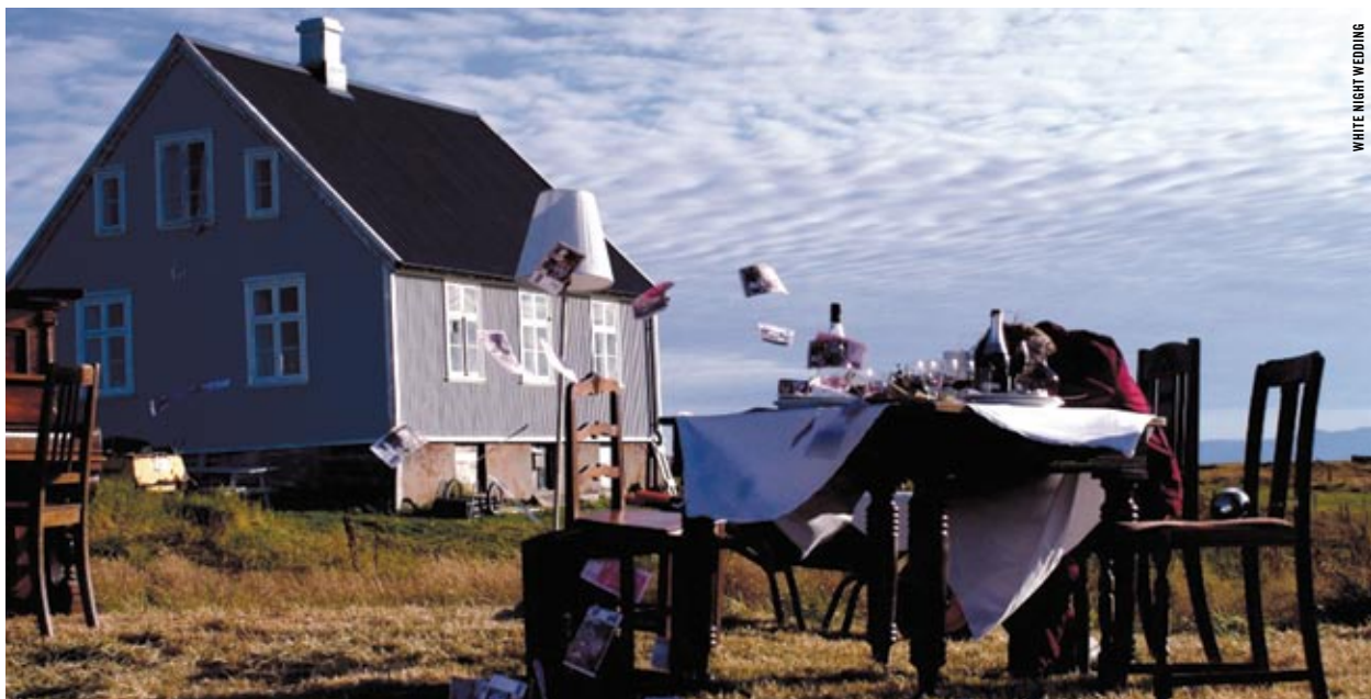
WHITE NIGHT WEDDING