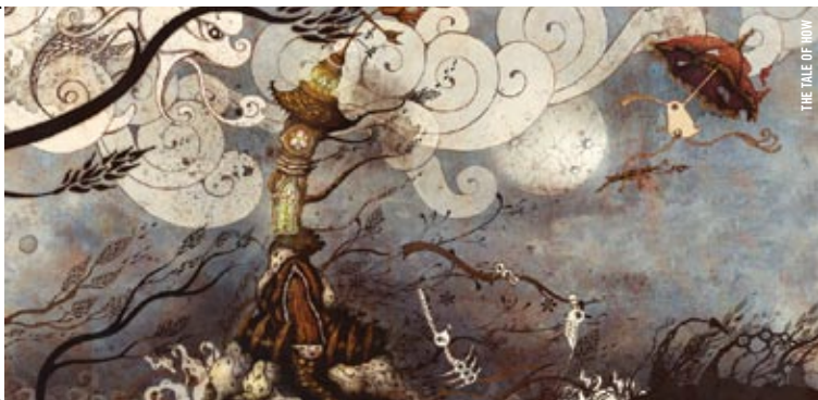
THE TALE OF KUYU

·: LES 9 ET 18 JUIN ·: Cette sélection de la BAMcinémathek de Brooklyn regroupe neuf films d'animation récents provenant d'autant de pays et qui repoussent avec audace les limites supposées de cet art. La Cinémathèque est honorée de présenter ce programme musclé et revigorant en grande première canadienne!