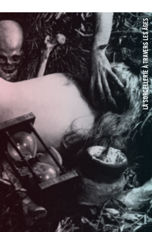
LA SORCELLERIE À TRAVERS LES ÂGES