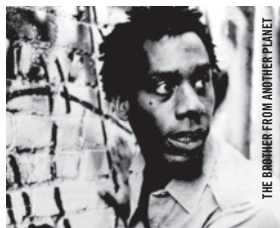
THE BROTHER FROM ANOTHER PLANET

19 h - Salle Claude-Jutra Cinéma de genre : Transgenres THE BROTHER FROM ANOTHER PLANET John Sayles [É.-U., 1984, 108 min, 35 mm, VOSTF]