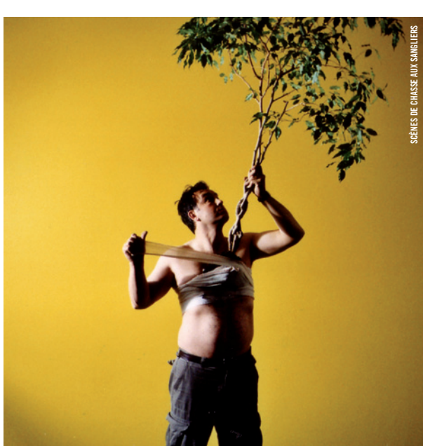
SCÈNES DE CHASSE AUX SANGLIERS