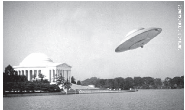
EARTH VS. THE FLYING SAUCERS