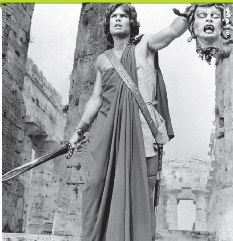
CLASH OF THE TITANS