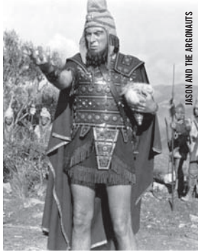
JASON AND THE ARGONAUTS

Babette Mangolte [É.-U., 2012, 35 min, num, SD]