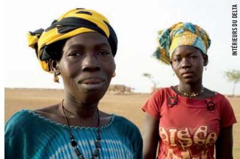
INTÉRIEURS DU DELTA