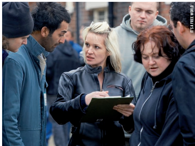
IT'S A FREE WORLD