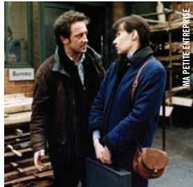
MA PETITE ENTREPRISE

Fred F. Sears [É.-U., 1956, 83 min, 35 mm, VOA] PRÉSENTÉ PAR PHIL BOOT • Repris le 25 avril, 16 h