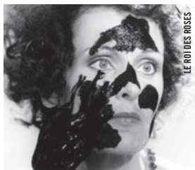
LE ROI DES ROSES