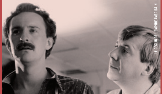
LE DÉCLIN DE L'EMPIRE AMÉRICAIN