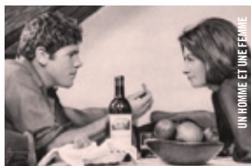
UN HOMME ET UNE FEMME

20 h 30 - Salle Claude-Jutra Cinémania : Anouk Aimée UN SOIR, UN TRAIN André Delvaux [Fr.-Belg., 1968, 86 min, 35 mm, VOF] EN PRÉSENCE D'ANOUK AIMÉE