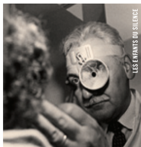
LES ENFANTS DU SILENCE