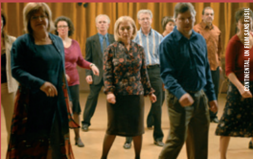
CONTINENTAL, UN FILM SANS FUSIL