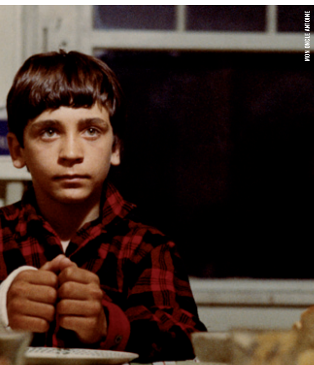
MON ONCLE ANTONIO

LISEZ LES RÉSUMÉS DES FILMS AU CINEMATHEQUE.QC.CA