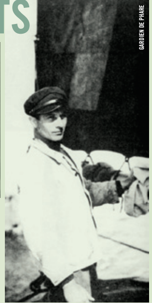
GARDIEN DE PAIRE