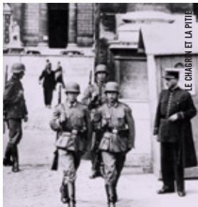
LE CHAGRIN ET LA PITIÉ

VENDEDI 15 NOV. 18 h 30 · Salle Claude-Jutra