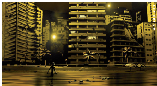
VALSE AVEC BASHIR

SUIVEZ-NOUS SUR TWITTER : CINEMATHEQUEQC