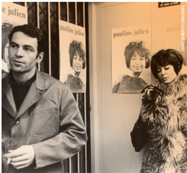
ENTRE LA MER ET L'EAU DOUCE

19 h - Salle Claude-Jutra Secrets et illusions, la magie des effets spéciaux L'ASPIRE DOWN Juan Solanas [Can.-Fr., 2012, 100 min, DCP, VOA]