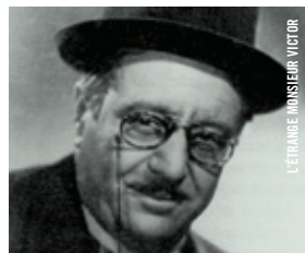
L'ÉTRANGE MONSIEUR VICTOR

SAMEDI 21 DÉC. 17 h - Salle Claude-Jutra À la demande générale ACAPULCO GOLD André Forcier [Qué., 2004, 88 min, Beta num, VOF] ENTRÉE LIBRE EN PRÉSENCE D'ANDRÉ FORCIER