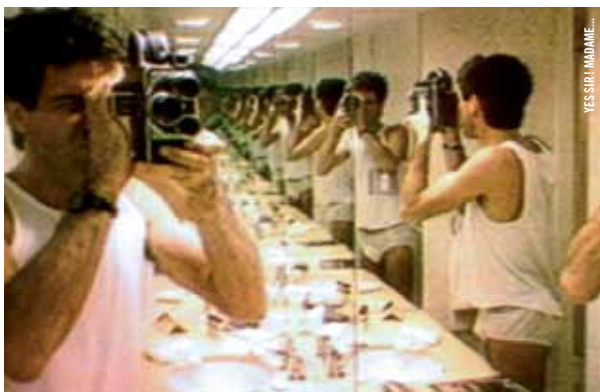
YES SIR! MADAME...

LISEZ LES RÉSUMÉS DES FILMS AU CINEMATHEQUE.QC.CA