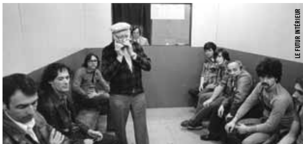
LE FUTUR INTÉRIEUR