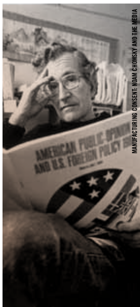
MANUFACTURING CONSENT: NOAM CHOMSKY AND THE MEDIA

20 h 45 - Salle Claude-Jutra Michel Brault : le directeur photo LE TEMPS D'UNE CHASSE Francis Mankiewicz [Qué., 1972, 98 min, 35 mm, VOF] • Repris le 15 février, 17 h