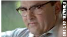
QUE DIEU BÉNISSE L'AMÉRIQUE