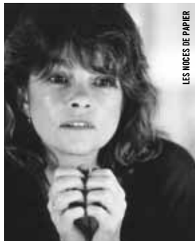
LES NOCES DE PAPIER

18 h 30 - Salle Claude-Jutra Michel Brault : le réalisateur LES NOCES DE PAPIER [Qué., 1989, 87 min, 35 mm, VOF]