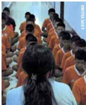
A RIPE VOLCANO

Thirdworld (Goh Gayasit) Apichatpong Weerasethakul (Th.-É.-U., 1997, 17 min, num, VOSTA); Ghosts in the Classroom Ukirt Sa-Nguanhai (Th., 2012, 2 min, num, VOSTA); Bangkok in the Evening Sompot Chidgasornpongse (Th., 2005, 16 min, num, VOSTA); Her Private London Sawit Prasertphan (Th., 2010, 35 min, num, VOSTA); A Ripe Volcano Taiki Sakpisit (Th., 2011, 15 min, num, VOSTA); The Anthem Apichatpong Weerasethakul (Th., 2006, 5 min, 35 mm, VOSTA) • Repris le 8 février, 21 h EN PRÉSENCE DE JOHN BLOUIN