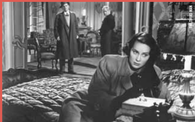
THE THIRD MAN

· DU 5 MARS À MAI · Pour son 50 e anniversaire, la Cinémathèque vous offre une occasion de voir ou de revoir l'ensemble des longs métrages d' Orson Welles et plusieurs de ses courts métrages. Ce cinéaste, scénariste et comédien génial, au talent démesuré, a transformé l'art de la fiction cinématographique. Dès le jeune âge de 24 ans, lorsqu'il tourne son premier long métrage Citizen Kane (1941), un de ses chefs-d'œuvre, jusqu'au célèbre F for Fake ( Vérités et mensonges ) avec lequel il pose les bases de ce qui deviendra le documenteur , nous pourrons voir se déployer son immense talent dans des films aussi magistraux que Le Procès (1962), Touch of Evil (1958) ou ses admirables adaptations de Shakespeare que sont Macbeth (1948), Othello (1952) ou Falstaff (1965). Ils seront accompagnés de documentaires sur lui, ainsi que par des films marquants d'autres réalisateurs dans lesquels il joue ou qu'il a coscénarisé.