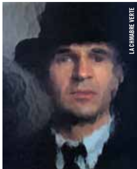
LA CHAMBRE VERTE

18 h 30 - Salle Claude-Jutra Cinéma muet en musique TARTUFFE F. W. Murnau [All., 1925, 16 mm, 74 min, muet] ACCOMPAGNEMENT AU PIANO PAR GABRIEL THIBAUDEAU