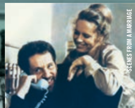
SCÈNES FROM A MARRIAGE