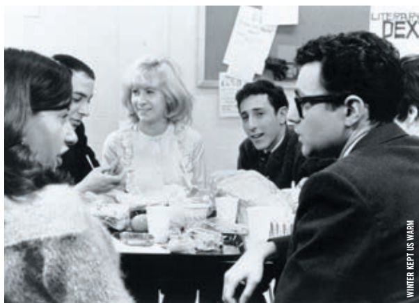
WINTER KEPT US WARM