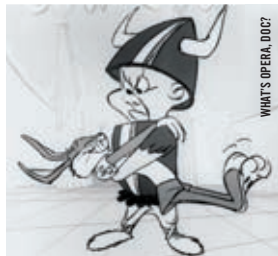
WHAT'S OPERA, DOC?

Guillaume Canet [Fr., 2002, 110 min, 35 mm, VOF]