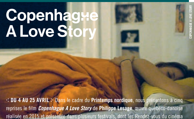
COPENHAGUE A LOVE STORY

DU 4 AU 25 AVRIL :: Dans le cadre du Printemps nordique , nous présentons à cinq reprises le film Copenhague A Love Story de Philippe Lesage , œuvre québéco-danoise réalisée en 2015 et présentée dans plusieurs festivals, dont les Rendez-vous du cinéma québécois et le Bafici de Buenos Aires. Ce film qui puise dans l'expérience du réalisateur des Démons est à la fois un autoportrait ironique (et parfois cruel), ainsi qu'une cartographie des sentiments de la jeunesse bohème danoise. Véritable tour de force, parvenant à accomplir l'aller-retour entre le portrait de groupe et les errances intimes, tourné en anglais et en danois, il révèle de surcroît Victoria Carmen Sonne dans son premier rôle au cinéma. En l'espace de quelques films, cette actrice est maintenant devenue une figure montante du nouveau cinéma danois. À voir, avec sous-titres français.