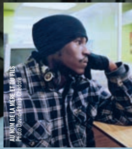
AU NOM DE LA MÈRE ET DU FILS