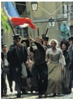
LOUISIANE