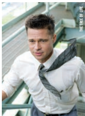
THE TREE OF LIFE