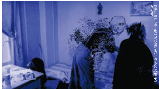
Extrait Stranger than Paradise , 1984, de Jim Jarmusch

DU 15 MARS AU 15 MAI :: En août 2016, le photographe Serge Clément amorçait une résidence de création à la Cinémathèque québécoise. Escale Cinéma présente le résultat d'un travail réalisé en scrutant nos collections. Ici, le cinéma et la télévision sont soumis à une recontextualisation par le biais de la photographie : images recadrées et photographiées sur des écrans de cinéma ou des téléviseurs, images brouillées par les interférences de la retransmission numérique, images hybrides des fondus enchaînés figées par l'intervention du photographe... À travers un film photographique, une publication et des tirages de divers formats, Escale Cinéma propose une relecture lyrique de nos souvenirs cinématographiques.