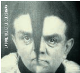
LA COQUILLE ET LE CLERGYMAN