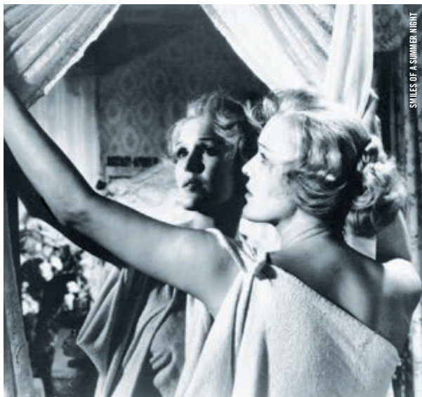
SMILES OF A SUMMER NIGHT

19 h · Hommage Niki Lindroth von Bahr COURTS MÉTRAGES Tord and Tord (Tord och Tord) [Suède, 2010, 11 min, num., VOSTA]; Bath House (Simhall) [Suède, 2014, 14 min, num., VOSTA]; Mon fardeau (Min Börda) [Suède, 2017, 14 min, num., VOSTF] CONVERSATION AVEC LA CINÉASTE ANIMÉE PAR MATTHEW RANKIN