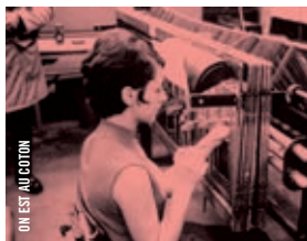
ON EST AU COTON

19 h · Bergman, l'œil de la mise en scène WILD STRAWBERRIES (SMULTRONSTÄLLET) [Suède, 1957, 91 min, DCP, VOSTA]