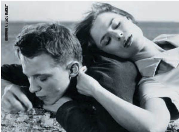
THROUGH A GLASS DARKLY

LISEZ LES RÉSUMÉS DES FILMS AU CINEMATHEQUE.QC.CA