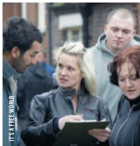
IT'S A FREE WORLD

21 h · Bergman, l'œil de la mise en scène SMILES OF A SUMMER NIGHT (SOMMARNATTENS LEENDE) [Suède, 1955, 102 min, DCP, VOSTA]