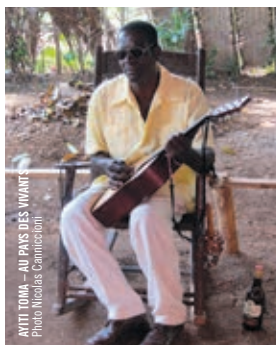
AYITI TOMA - AU PAYS DES VIVANTS

Joseph Hillel [Qué., 2014, 82 min, DCP, VOSTF] EN PRÉSENCE D'INVITÉS