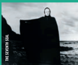
THE SEVENTH SEAL

DU 3 AU 30 AVRIL : Ce printemps, nous nous associons au Printemps nordique et à la Place des arts pour montrer des événements qui mettent en valeur la production scandinave d'hier et d'aujourd'hui. Bien entendu le fleuron suédois, Ingmar Bergman est à l'honneur. Dans ce contexte, nous proposons la première rétrospective de ce cinéaste chez nous depuis les années 1990. Il n'était pas difficile de mettre en place une grille autour des films phares de Bergman puisqu'ils sont nombreux et que chaque œuvre constitue une pierre posée à un édifice sans équivalent. Œuvre marquée par la représentation de la vie intime –