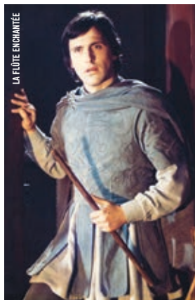
LA FLÛTE ENCHANTÉE

21 h · Bergman, l'œil de la mise en scène SARABANDE (SARABAND) [Suède, 2003, 107 min, num., VOSTF]