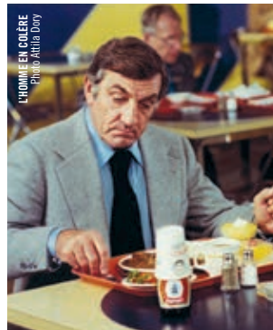
L'HOMME EN COULÈRE