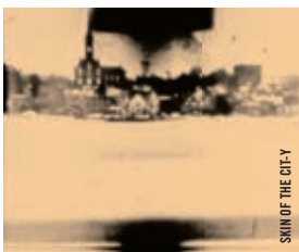
SKIN OF THE CITY