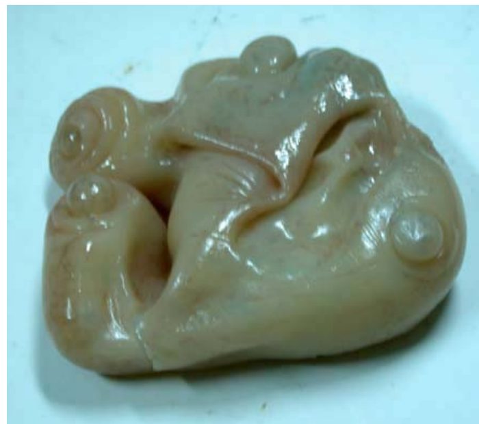
Jeu / 2006.0004.OB (caoutchouc, métal) – collection Cinémathèque québécoise. Effet spécial pour le film EXISTENZ (1999) de David Cronenberg.

Ouvrage sur l'artiste maquilleur Tom Savini illustré par des démonstrations de certains effets pour les films sur lesquels il a travaillé.