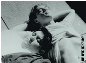
THE HANGING GARDEN

gai, lesbien, bisexuel et trans. Nous débutons le cycle avec des films qui ont été pionniers dans la manière de montrer la communauté LGBT. Ma vie en rose d'Alain Berliner, ainsi que The Hanging Garden de Thom Fitzgerald, ont à cet égard marqué le cinéma des années 1990.