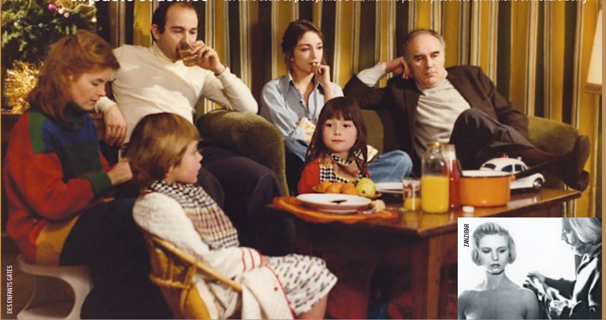
DES ENFANTS GÂTÉS

· DU 4 AU 17 SEPTEMBRE · La cinéaste Christine Pascal disparue trop rapidement il y a un peu plus de 20 ans a laissé derrière elle une cinématographie conséquente qui pose la question du féminin, tout en représentant les rapports de famille et les rapports de force. D'abord actrice chez Miller ou Tavernier, elle écrira avec ce dernier Des enfants gâtés où elle tient l'affiche avec Michel Piccoli, avant un passage à la réalisation dont l'aboutissement est sans doute Le petit prince a dit , illuminé par les présences d'Anémone et Richard Berry.