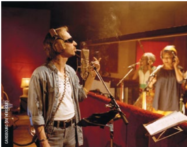
GAINSBOURG (VIE HEROÛLE)