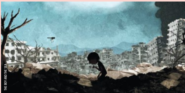
THE BOY AND THE SEA