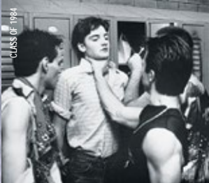
CLASS OF 1984