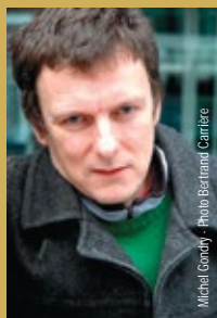
Michel Gondry

· LE 1 ER SEPTEMBRE · Dans le cadre du festival Chromatic, la Cinémathèque a le plaisir d'accueillir Michel Gondry, le réalisateur d' Eternal Sunshine of the Spotless Mind , Be Kind Rewind , Microbe et Gasoline ... Il donnera une classe de maître, à la fois didactique et ludique, dans la foulée de L'Usine de films amateurs de Michel Gondry, présentée à Montréal du 1 er septembre au 15 octobre.