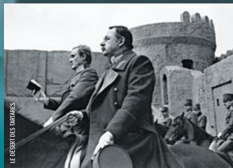
LE DÉSERT DES TARTARES