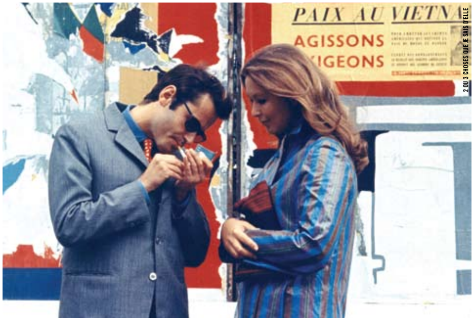
2 OU 3 CHOSES QUE JE SAIS D'ELLE

VOUS TROUVEREZ LES DESCRIPTIONS COMPLÈTES DES CYCLES PRÉSENTÉS ET LES SYNOPSIS DES FILMS À CINEMATHEQUE.QC.CA