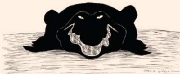
THE OLD CROCODILE