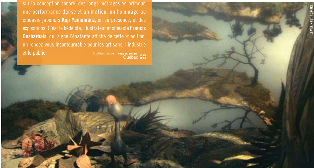
LE VILAIN PETIT CANARD