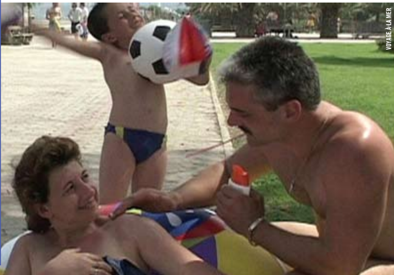
VOYAGE À LA MER