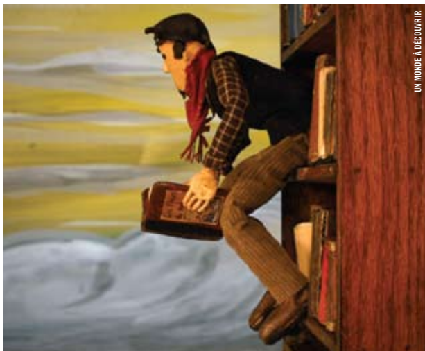
UN MONDE À DÉCOUVRIR

En collaboration avec Régie du cinéma Québec