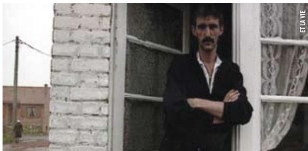
ET LA VIE