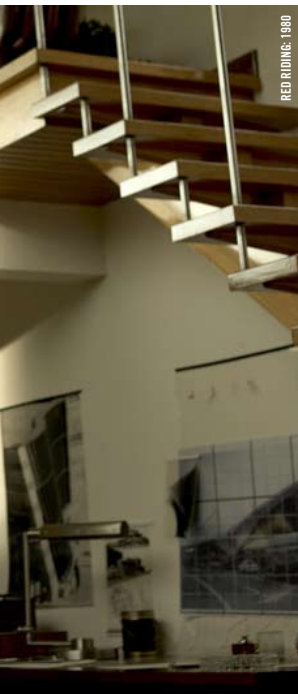
RED RIDING, 1980

Lars von Trier [Dan.-Suède-Fr.-P.-B.-Norv.-Isl., 1996, 159 min, 35 mm, VOA]