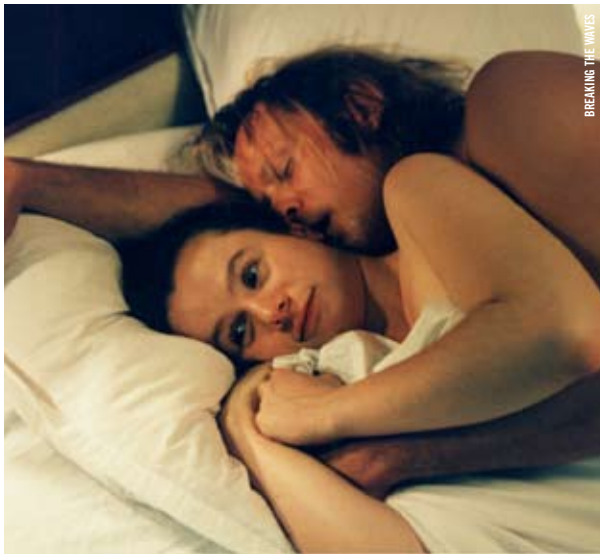
BREAKING THE WAVES