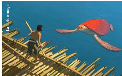
La tortue rouge

20 h 15 · Joseph Losey, l'indomptable Le messager (The Go-Between) [R.-U., 1971, 116 min, num., VOSTF]