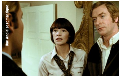
Une Anglaise romantique

18 h · Histoire du cinéma québécois La position de l'escargot (CC) Michka Saäl [Qué., 1998, 101 min, 35 mm, VOF]