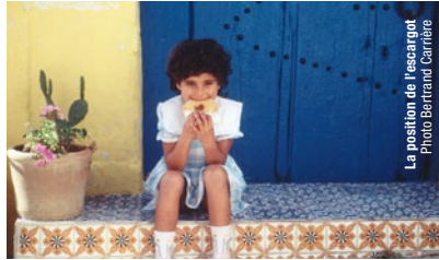
La position de l'escargot

20 h · Joseph Losey, l'indomptable Boom [R.-U., 1968, 113 min, num., VOA]